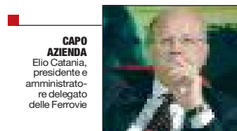
CAPO AZIENDA Elio Catania, presidente e amministratore delegato delle Ferrovie